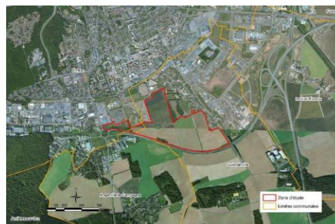
Figure 1 : Localisation du site (Limites approximatives)